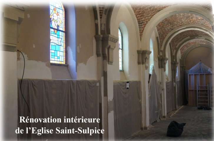
Rénovation intérieure de l'Eglise Saint-Sulpice

Vous préparez votre installation ou vous venez d'arriver à Recquignies ? Nous vous souhaitons la bienvenue !