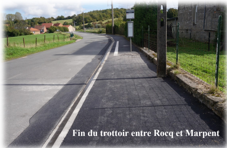
Fin du trottoir entre Rocq et Marpent