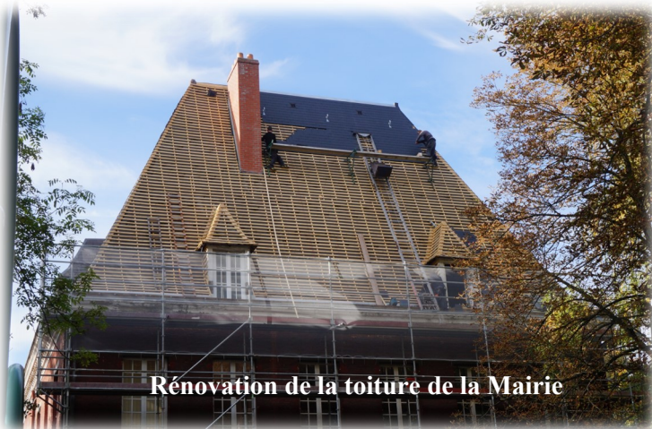
Rénovation de la toiture de la Mairie