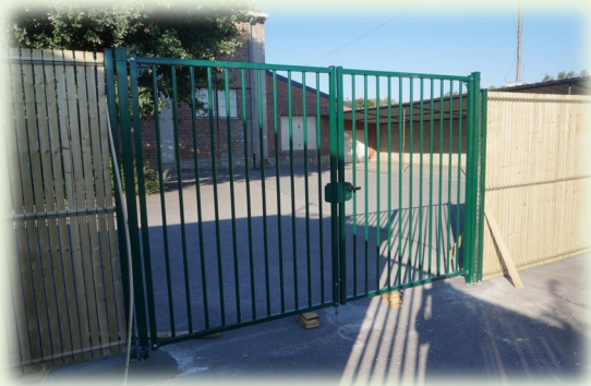
Pose d'une nouvelle clôture entre le logement et la cour de l'école du Centre.

L'affichage est obligatoire et doit être visible de la voirie (article R424-15). Il doit y être mentionné le numéro de dossier, la nature des travaux et la date d'accord. Le délai de recours est de 2 mois à compter de l'affichage sur le terrain.