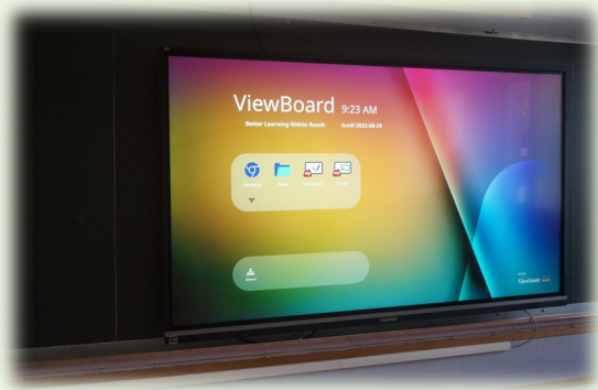
Mise en place des Ecrans Tactiles Interactifs dans les écoles primaires.

Poursuite de la réfection intérieure de l'Eglise de Recquignies, aménagement du trottoir entre Rocq et Marpent, et démarrage des travaux de rénovation de la toiture arrière de l'Hôtel de Ville