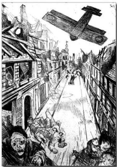
Lens occupée par les Allemands et détruite par les bombes françaises ou britanniques.

Eau forte d'Otto DIX, peintre et soldat allemand.