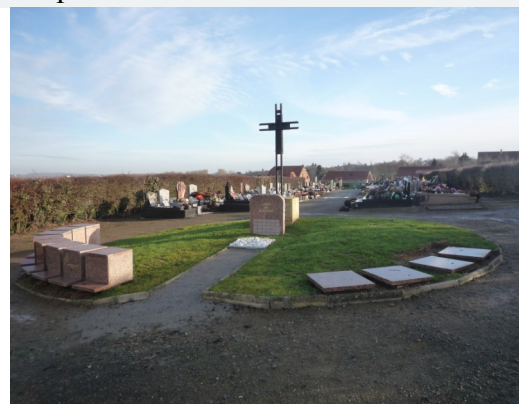
Jardin du Souvenir à Rocq