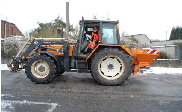
Salage et déneigement des rues de la commune par le service technique.

Nous remercions toute l'équipe du service technique pour le travail accompli et leur disponibilité lors des différents épisodes neigeux. Pas moins de 30 tonnes de sel ont été répandues sur les rues de notre commune, ceci pour le confort de tous.