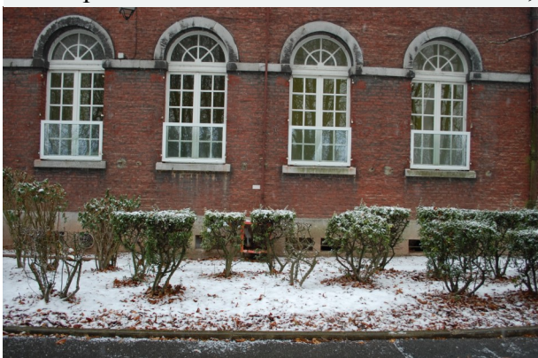
Protection aux fenêtres de la Mairie