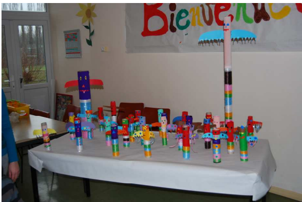
La famille totem

douceurs pour les papilles sans oublier, le traditionnel thé à la menthe. Dès lors, il était temps de faire place à la danse. Plus précisément à une chorégraphie d'influence orientale, réalisée avec enthousiasme par une dizaine d'élèves.