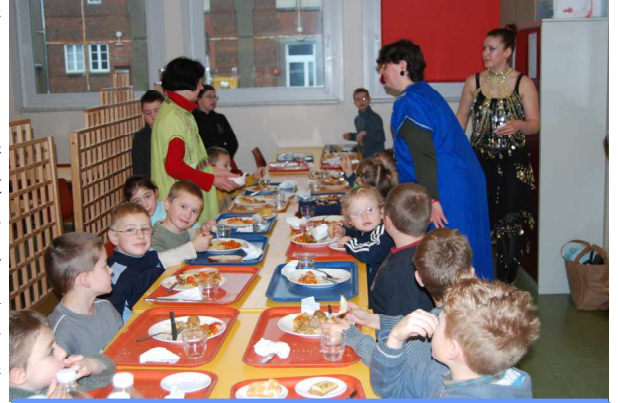
Couscous royal, c'est un régal !

Initiée par A.P.I Restauration, en partenariat avec les écoles primaires de la commune et la municipalité, l'événement avait pour but de faire « toucher du doigt », à nos chères têtes blondes, quelques spécificités de la culture orientale.