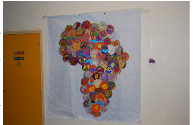
L'Afrique en mandalas

Afin de terminer dignement ce repas original, petits et grands se sont régalés de pâtisseries orientales, véritables douceurs pour les papilles sans oublier, le traditionnel thé à la menthe. Dès lors, il était temps de faire place à la danse. Plus précisément à une chorégraphie d'influence orientale, réalisée avec enthousiasme par une dizaine d'élèves. La petite troupe est parvenue à réchauffer l'ambiance en invitant une joyeuse et remuante ribambelle à entrer dans la danse, tout ce petit monde encadré par les adjoints techniques, les ATSEM, les maîtres des écoles et l'animatrice municipale... tous costumés pour l'occasion.