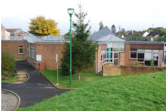
Ecole Primaire Jean VILAR (Rocq)