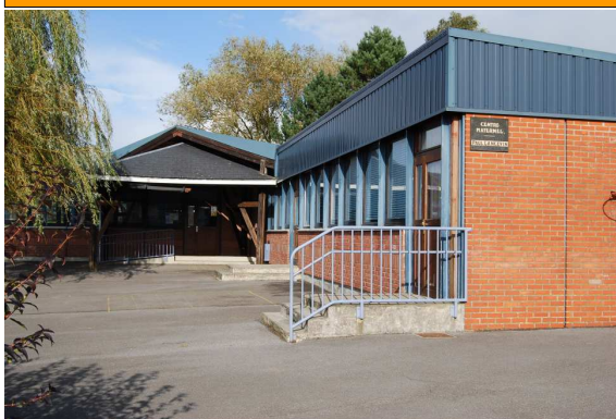
Ecole Maternelle Paul LANGEVIN (Recquignies)